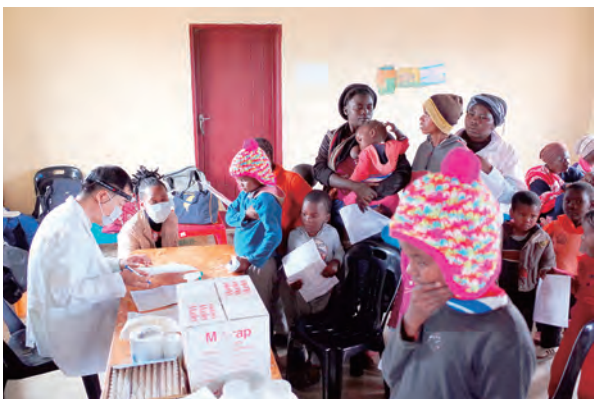
▲社區活動中心坐滿了等候看診村民，醫師們把握時間盡力看診。