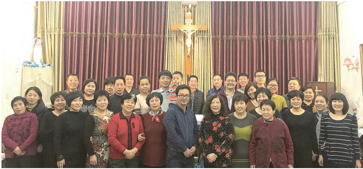
▲福傳到海峽彼岸，在主內融樂一堂。