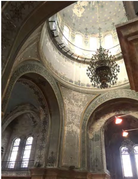
▲在典雅的哈爾濱蘇菲亞大教堂，生思古之幽情。

在天津3天正好碰到嚴重的霧霾，真是出門伸手不見五指，但楊神父還是想辦法，帶我們去參觀了幾個名勝古蹟。在獨樂寺，我們參觀了清朝乾隆皇帝百年的寢宮及寺廟。斑駁的牆壁上看到了乾隆皇帝親筆寫的警世之言「傲不可長，欲不可縱，志不可滿，樂不可極」，