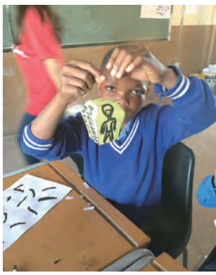
▲史國學童展示自己做的燈籠