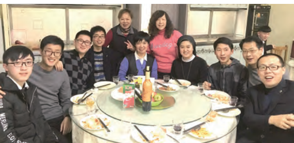
▲與戒修女（中坐者）及吉林修院修士們共聚，感受主內一家親。

第四站到哈爾濱，我們參觀了舉世聞名的哈爾濱蘇菲亞大教堂和冰雕；蘇菲亞大教堂是遠東地區最大的東正教教堂，教堂現在已改為哈爾濱建築藝術館，不再行使宗教功能；「聖蘇菲亞」詞源為「神聖的智慧」，是多麼美麗的名稱。文革期間遭破壞、長期當作倉庫，世紀末都市更新，才再現風華，建築屬拜占廷式俄羅