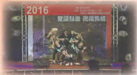
大坪林聖三堂 聖誕點燈 (MOD藝文饗宴)