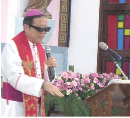
▲鍾安住主教以特殊造型講道，吸睛全場。