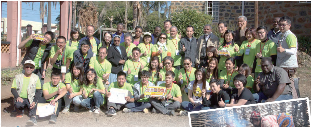
▲史瓦濟蘭國際服務志工與明愛會人員合照 ▶GOGO為NCP照顧的孩子們煮午餐