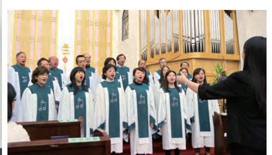
▲衛理公會恩友堂詩班美聲讚主榮 ▲聖公會聖約翰座堂的基督徒合一詩歌祈禱會大合照