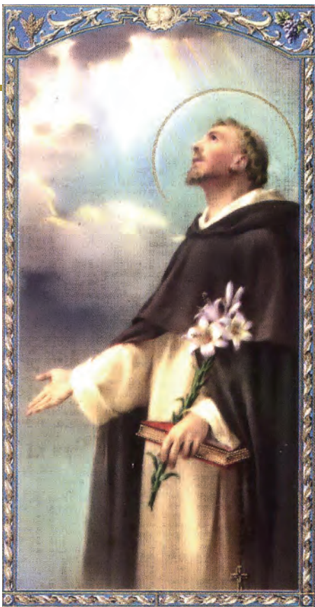
▲會祖聖道明守貞如玉，宛如玉甄，身在塵世，心繫天廷。