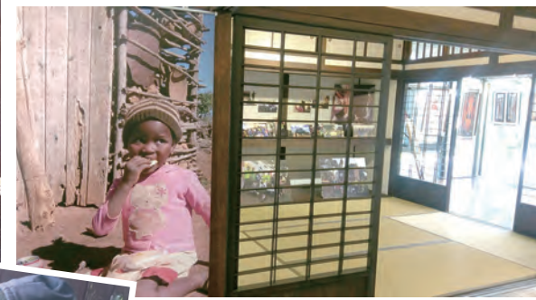
▲充滿非洲風的文學館 ◀當地青年協助我們做初步資料登記工作

流，努力的探知世界的想像。由於史國教育支出成本昂貴，我們特別針對當地優秀的弱勢學生提供就學經費資助，透過在台灣為這些「逆風少年」募款以及當地資源的連結，結合台灣地區對於邦交國家提供優秀學子獎學金，實質鼓勵史國學子持續進修提升，資助了4名當地高中學生，升學所需費用。同時，也利用3天時間安排偏鄉小學的教學服務，Esigcineni Primary School、Ngwazini Primary School、Thulwane Primary School。一進到校門口，就看到全校學生整隊就緒，手中拿著微笑的圖案，唱著當地歌曲，歡迎這一群來自遙遠亞洲的朋友，孩子們靦腆而熱情的笑容，讓志工們無不希望在短短的時間內將課程內容，華文學習、中國功夫、CPR訓練課程、書法體驗、歌曲教唱，透過班級分享給這些非洲的孩子，激發他們對於學習的想像，以及和世界文化接軌。