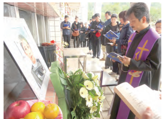
▲數十位修女及教友送嘉安姊妹到高雄聖山,以歌聲和禱聲為她圓滿行安住禮。