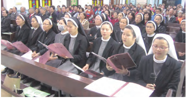
▲修女和平信徒們虔心為基督徒合一祈禱