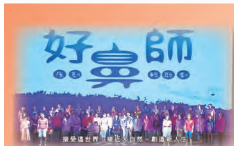
輕歌劇—好鼻師 (MOD藝文饗宴)