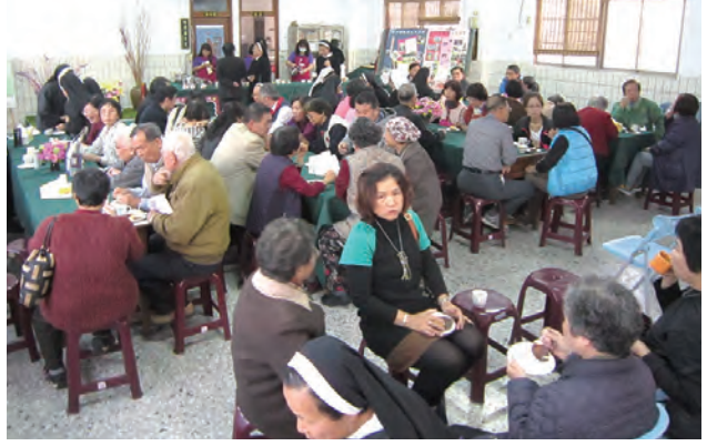
▲各基督宗派兄弟咖啡共融，主內肢體情感交融，濃郁芬芳。