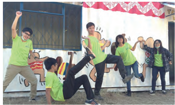
▲貨櫃改造完成，學生志工們開心舞蹈。

由於非洲地區物資缺乏，加上人民平均所得不高，當地孩童多半以玉米糊為主食，長期下來，呈現營養不良的狀態。為此，明愛會在各個偏鄉地區，建置社區關懷站(Neighborhood Care Point 簡稱NCP)照顧孩子們的食食物以及教育的需求。因此這一次我們募集了10個NCP經費，提供約400名兒童，每天能有一餐的溫飽，希望他們可以快樂且健康的成長。(文轉23版)