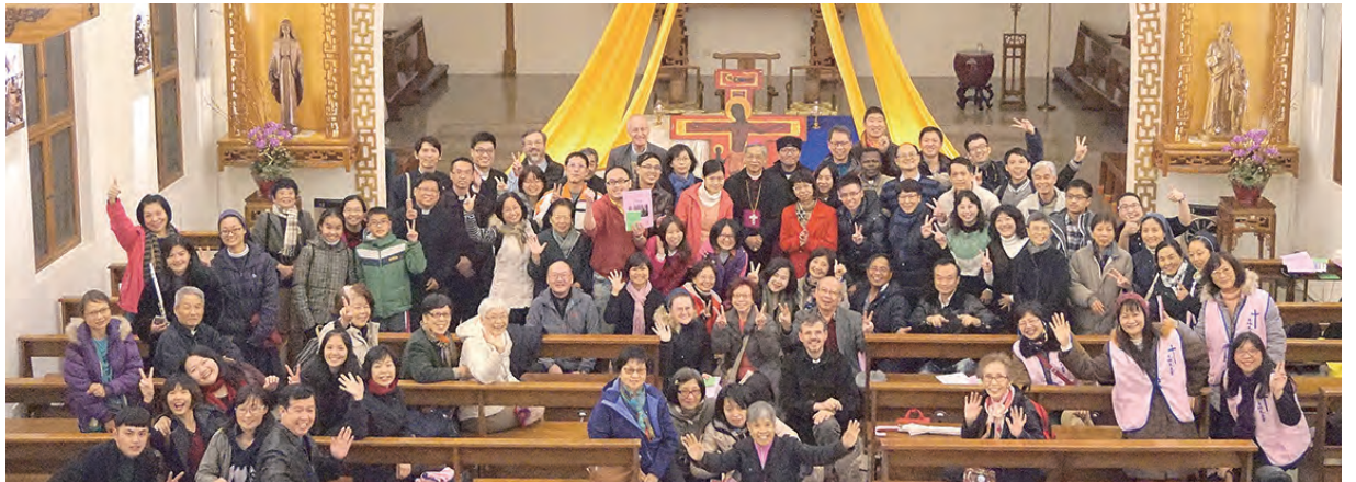
▲參與基督徒合一祈禱周的信徒們在士林天主堂大合照