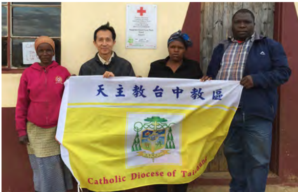
▲為NCP孩童募集一年餐費，希望他們平安健康長大。