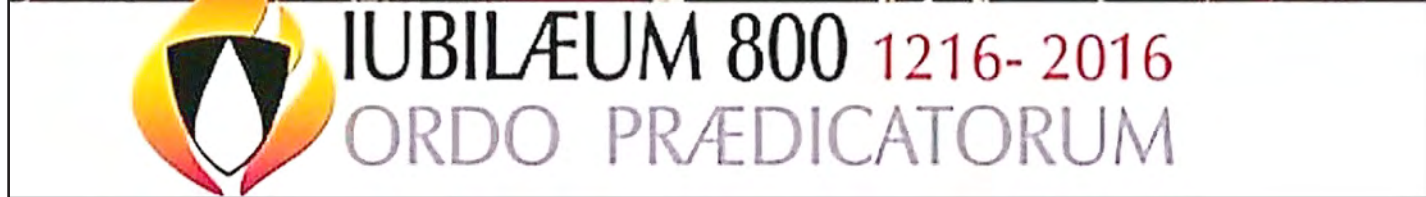
▲教宗何諾理三世1216年12月22日批准道明會正式成立，至2016年的全年，普世教會的整個道明會大家庭都歡度創會800禧年的慶典，教廷於2017年1月21日在羅馬拉特朗大殿舉行閉幕典禮，台灣教會也組了朝聖團參與盛會。