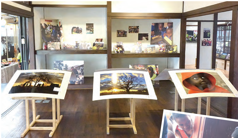
▲豐富而有特色的展出深受好評