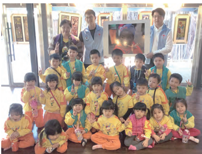
▲幼稚園安排戶外教學，這是一堂很特別的生命教育。

教育是百年大計，也是改變現狀的最佳途徑。在服務的過程中，我們看到了史瓦濟蘭弱勢青年積極向上的努力，他們或者長途跋涉每天通勤時間超過兩個小時，或者家庭貧困全家八口僅能容身在狹小的居住空間，又或者透過自身打工努力籌措學費，但他們不以為意，還是堅持與把握著學習的機會，只想透過這些努力，改變自己、改變家庭甚至改變整個社會。而在校園中的學子，也期待透過偏鄉學校的文化交