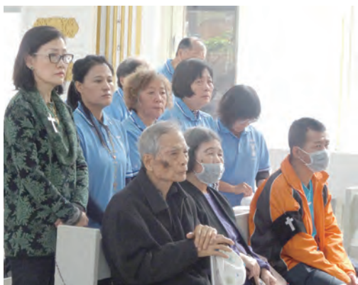
▲嘉安父母白髮人送黑髮人情何以堪,還好有堂區的聖母軍及教友們幫忙照顧。

嘉安在世時,有些人並沒有善待她,甚至多所挑剔,但這些都不重要了,因為她是不會記恨的,期望大家能多關心她的家人來稍作彌補;謝謝長期陪伴她的教友,和默默地協助並陪伴她的家人辦好治喪事宜的人,特別是高雄左營小德蘭堂的神父、修女及傳協會主席帶領教友們,各支團聖母軍的夥伴,都一起陪她走最後一程;靈醫會台北分會的黃浩然神父特地南下,與高齡88歲的小德蘭老本堂潘瓊輝神父一起共祭,靈醫會家庭、天主教神恩代禱網的伙伴們,嘉安的老同學、朋友、公司老闆及同事們的奉獻、祈禱和獻彌撒,我們跟隨耶穌,學習聖母的精神,願嘉安的精神永遠在我們的心中,光榮歸於天主!一切感謝讚美天主聖三,阿們!