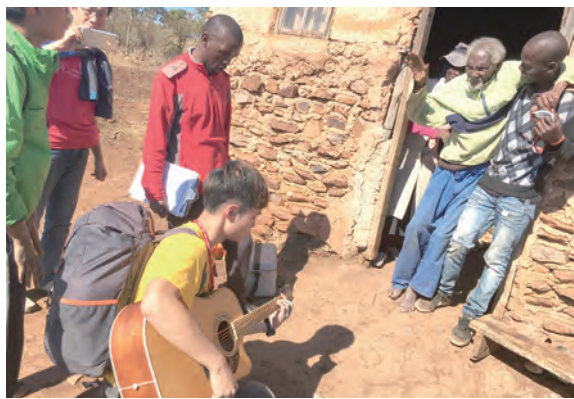
▲探訪偏鄉村民，學生的歌唱讓長者十分歡喜。