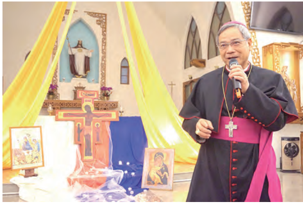
▲洪山川總主教給主內肢體的期勉與降福