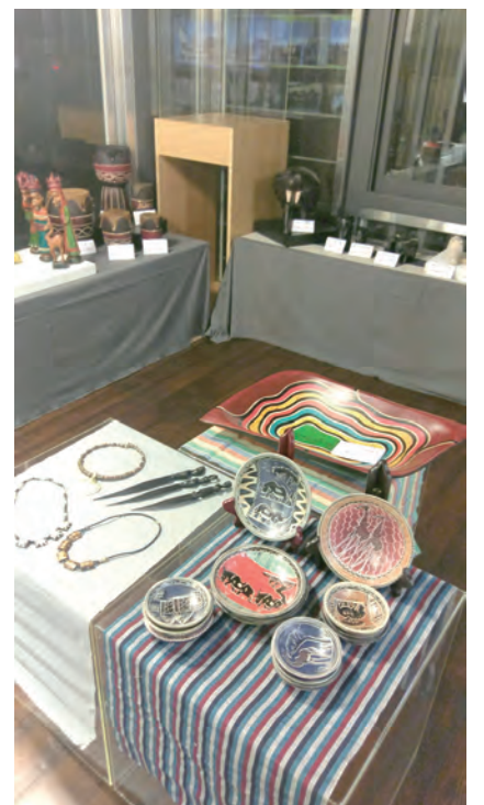
▲充分運用空間，使展品呈現多樣貌。