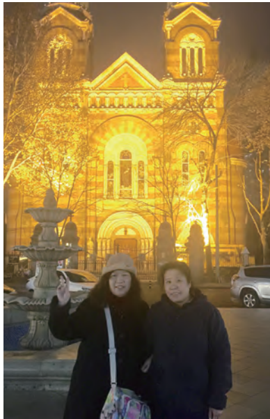
▲聖誕節期的教堂總是妝點得美不勝收。