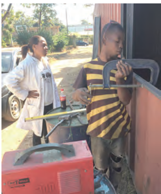
▲史國青年一起貨櫃改造工程